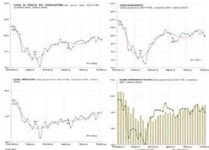
Graf. S1.A Indici del clima di fiducia dei consumatori

L'indice generale dei prezzi nel 2024 dovrebbe risultare pari all'1,0 per cento; la componente di fondo si dovrebbe attestare al 2,0 per cento.